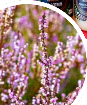
Ljungens nektar ger fin honung.