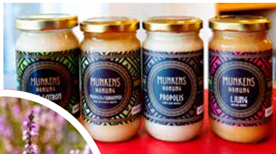
Olika sorters honung.

2014 hyrde han lokal i Ramnäs för verksamheten, sju år senare i Surahammar och nu i Hallstahammar. Namnet på företaget, Munkens Hälsa AB; och produkterna som görs är grundat på traditionella klosterrecept med anor från Norden och vikingarnas kärlek för honung.