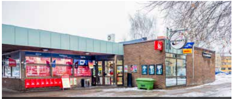
Det har alltid funnits en kiosk i byggnaden som uppfördes 1972.

– Det är bättre om man har sitt eget företag i stället för att behöva jobba för någon annan. När vi kom till Sverige bodde vi i Stockholm där jag jobbade som pizzabagare. När jag såg att kiosken i Hallstahammar var till salu flyttade jag och min fru hit till