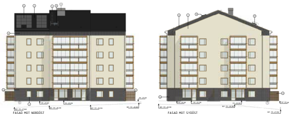
Skisser på punkthuset som kommer att rymma 34 lägenheter.