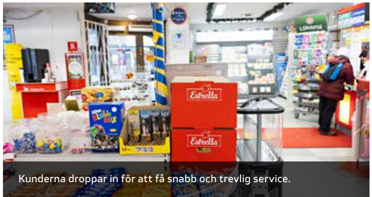
Kunderna droppar in för att få snabb och trevlig service.