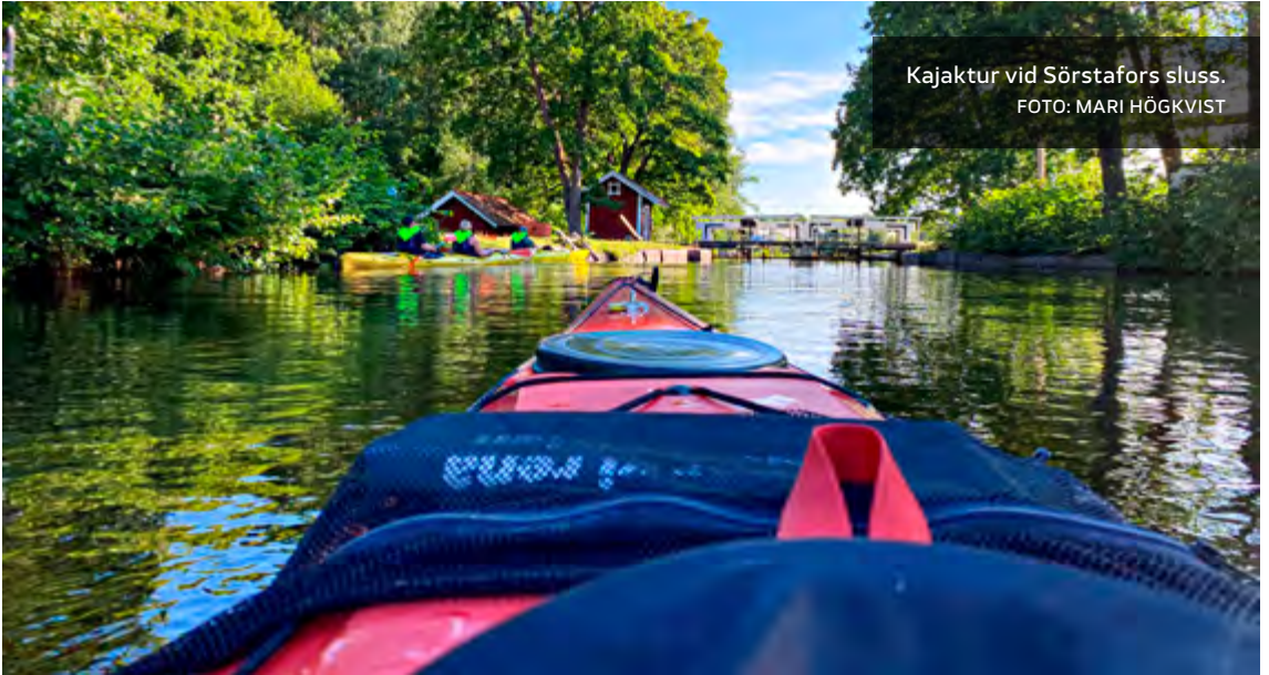
Kajaktur vid Sörstafors sluss.